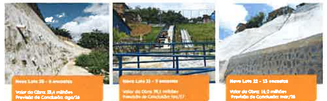
Novo Lote 08 - 6 encostas Valor da Obra: 35,4 milhões Data de Conclusão: ago/24