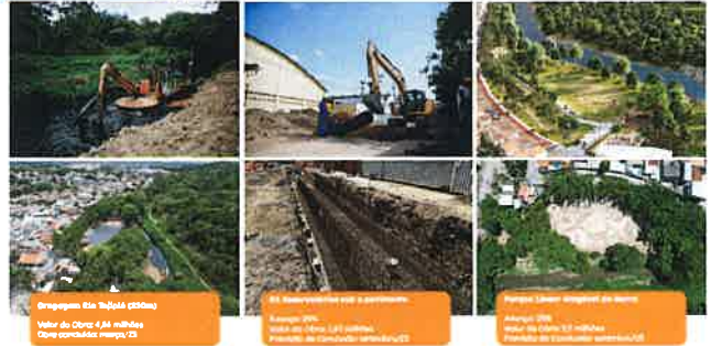
Grupos em tubos (30m) Valor da Obra: 4,66 milhões Data de Conclusão: mar/24